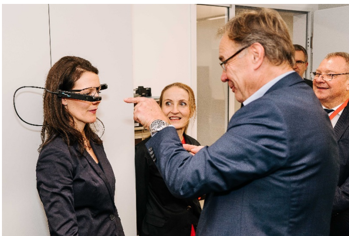
Zukunftsorientiert: Mitsubishi Electric und Yamazaki Mazak arbeiten bereits an neuen Remote-Service Lösungen