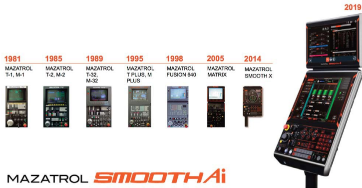
Die Evolution der Mazatrol Steuerungen – von 1981 bis heute