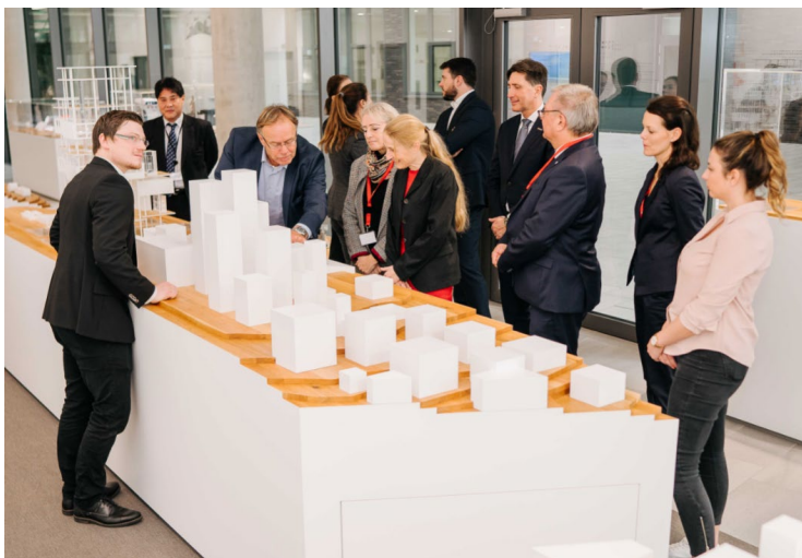
Die geladenen Gäste bei der Führung durch die Produktausstellung „The World of Mitsubishi Electric“