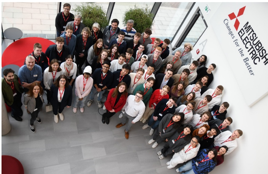
Die TeilnehmerInnen des changes.AWARD 2024 beim Kick-off in der Deutschlandzentrale von Mitsubishi Electric am 2. Februar 2024.

Während der Kick-off-Veranstaltung am 2. Februar erhielten die mehr als 70 Teilnehmerinnen und Teilnehmer von neun Schulen Einblicke in das Wettbewerbsthema und den Ablauf. Ein Highlight der Auftaktveranstaltung war neben dem Kennenlernen der persönlichen Coaches und Lehrer der Erfahrungsbericht des Vorjahres-Siegerteams „flow“, welches die Jury 2023 mit einem Add-on für Head Up Displays in Autos überzeugte, das den Verkehrsfluss intelligent lenkt und dadurch Feinstaub verringert.